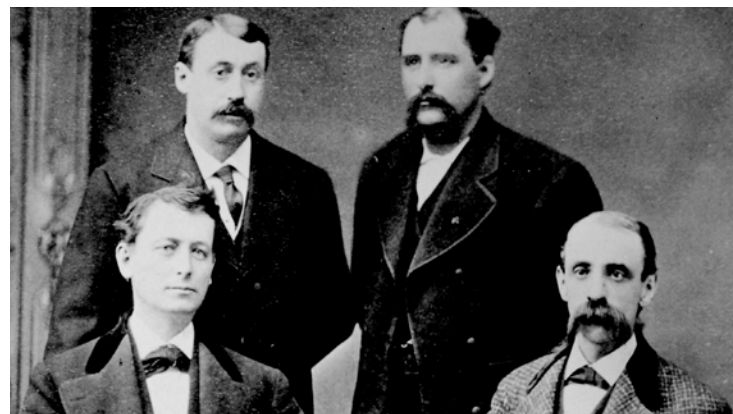
هذه الصورة هي الصورة المعروفة الوحيدة التي تم التقاطها لمؤسسي كمبرلي-كلارك الأربعة معاً باتجاه عقارب الساعة من الجهة اليسارية العلوية: تشارلز ب. كلارك، فرانك س. شاتاك، هافيلاه بابوك وجون أ. كمبرلي